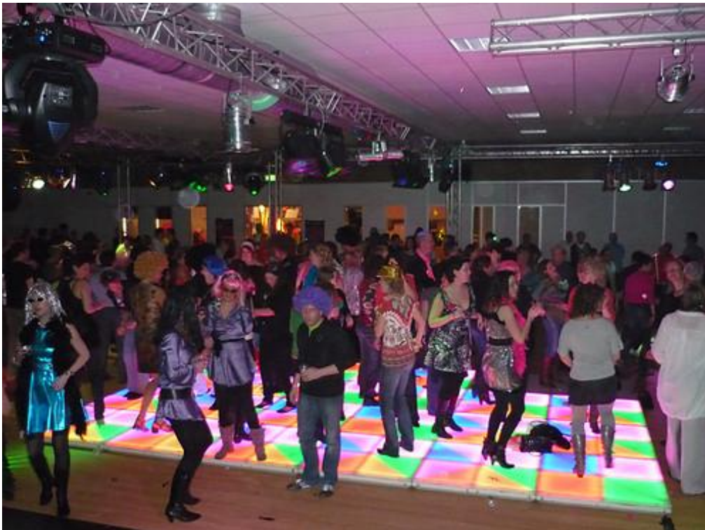
Gasten op de dansvloer tijdens het thema feest 'Boogie 2 Nite'