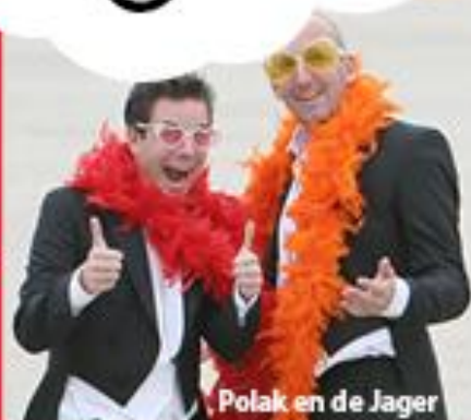
Polak en de Jager

Indien gewenst een Afterparty tot 02.00 uur met DJ en dansvloer!