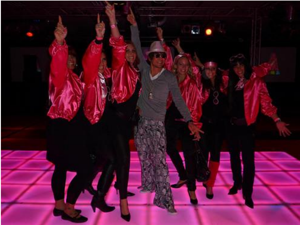
Gasten op de dansvloer tijdens een thema feest 'zuurstok'