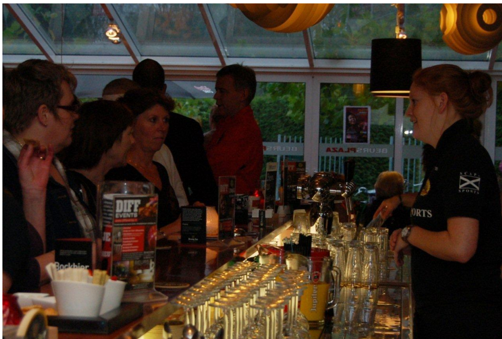
Gasten tijdens een bedrijfsborrel in Beursplaza

Het is mogelijk om te werken met een DJ (inclusief DJ set, lichtset en dansvloer).